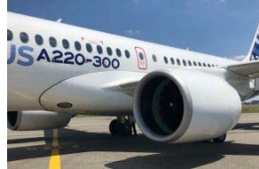
Airbus A220-300