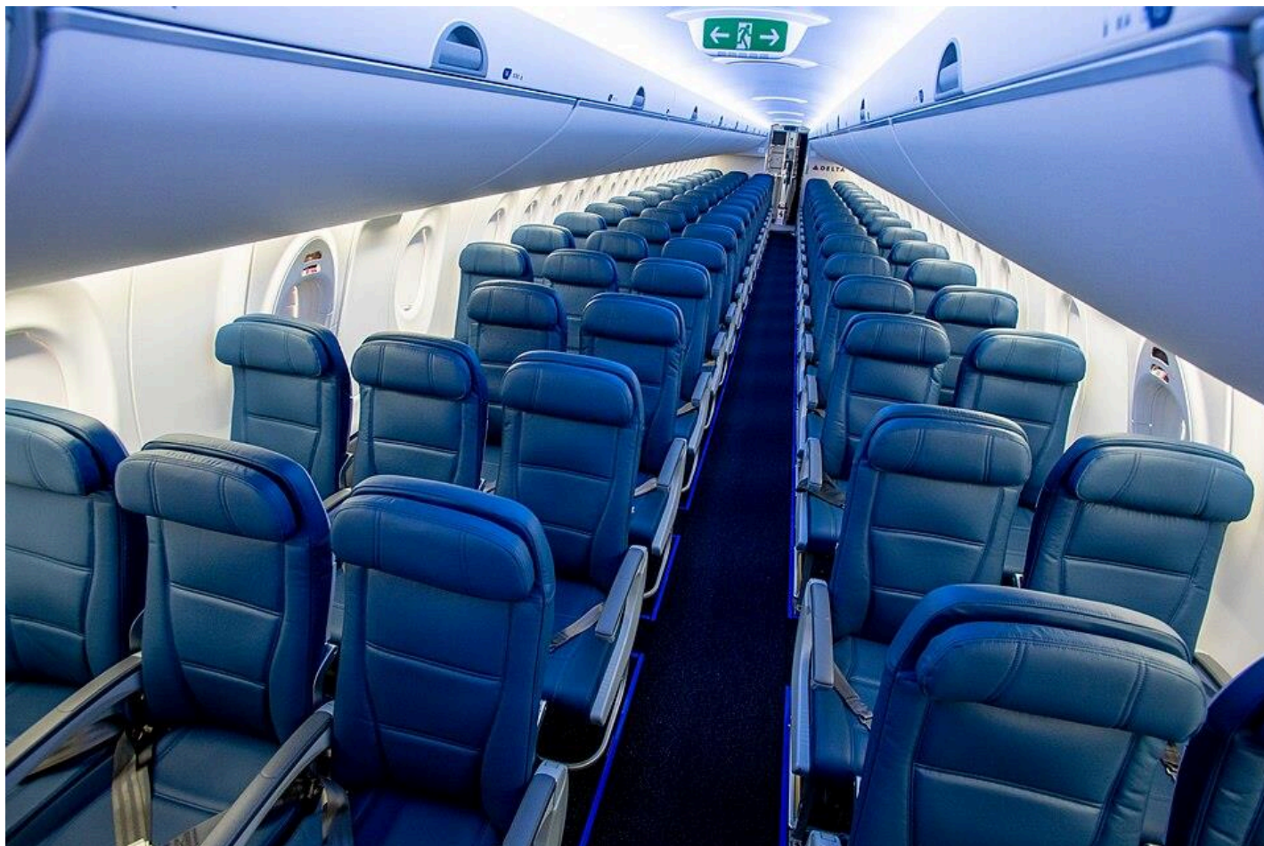
Nejběžnější konfigurace kabiny Airbusu A220