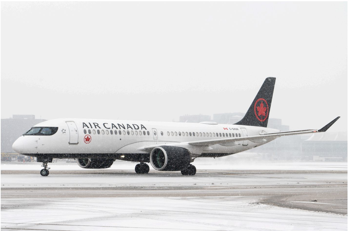
Airbus A220 společnosti Air Canada